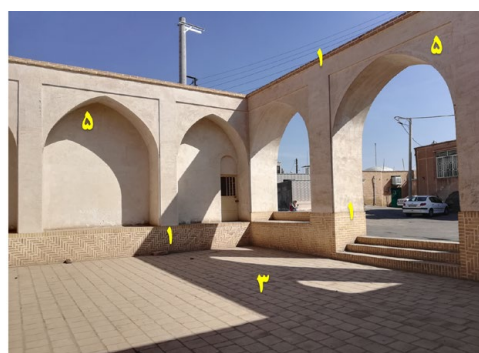
تصویر ۳: گشودگی محله سیقن

مصالح خاکی، یکی از قدیمی ترین و گسترده ترین مصالح ساختمانی مورد استفاده توسط بشر به ویژه در نواحی گرم و خشک بوده اند (درمحمدی و رحیم نیا ۱۳۹۶)؛ چراکه دارای خواص انتقال حرارتی بهینه برای گرمایش زمستانی و سرمایش تابستانی، دسترسی آسان و سازگاری با آب و هوای محیط و همچنین رنگ روشن برای جلوگیری از گرم شدن ساختمان هستند. ناگفته نماند مصالحی که رنگ روشن دارند، جذب حرارتی کمتری داشته و انرژی خورشید را منعکس می کنند (Calkins 2008). رایج ترین مصالح خاکی مورد استفاده در این مناطق شامل خشت، آجر و انواع ملات های گلی (مانند کاهگل، ساروج، شفته آهک، گچ خاک و...) هستند که دارای مراحل ساخت ساده و سریعی بوده و در گذشته، در محل ساخت بنا با استفاده از خاک حاصل از گودبرداری، توسط کارگران تولید می شده اند.