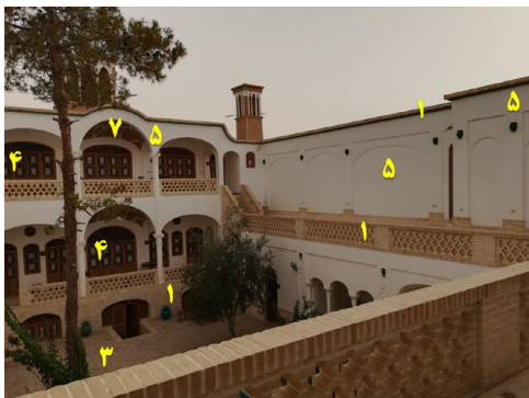
تصویر ۲: نمای داخلی خانه تاریخی عزیززادگان