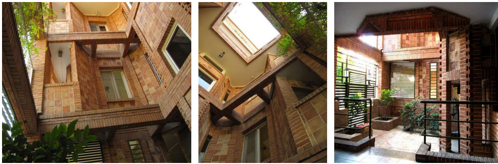
تصویر ۲: فضای ورودی و بخش پیش‌آمدگی آپارتمان قیطره ( https://archnet.org/ )

ایده معماری در طراحی این آپارتمان «تخلخل» ۲۴ بود که این ایده با تعبیه قاب‌های متعدد در جهت‌های گوناگون در سطح نمای آپارتمان قیطره پی گرفته شده است. از این نظر در نمای آپارتمان قیطره، ترکیب‌بندی شکل‌ها و خطوط ریتمی پویا ایجاد کرده و باعث برجسته شدن خصوصیات طرح می‌شود. این طرح متکثر با ترکیبی از قاب‌ها و اجسام سازه‌ای در نما، عرصه‌های نیمه‌باز برای طبقات پایین فراهم کرده و در عین حال پنجره‌ها و منفذهای بسیاری در نما تعبیه شده است. بنابراین فضای بیشتری از واحدها از نور روز و تهویه طبیعی بهره‌مند می‌شوند. پیش‌آمدگی نما تا تراز طبقه دوم فضای ورودی نیمه‌باز با نورگیری زیاد و هواخوری بالا در پلکان دسترسی طبقات ایجاد کرده است. این تمهید در طراحی و ساخت نمای آپارتمان قیطره عرصه‌هایی نیمه‌خصوصی و مرزی میان فضاهای داخلی خانه با خیابان و جدارۀ شهری تعریف می‌کند که در جهت حفظ حریم ساختمان در طبقات پایین و در عین حال ایجاد امکان دید به منظر شهری عمل می‌کند (تصویر ۲).