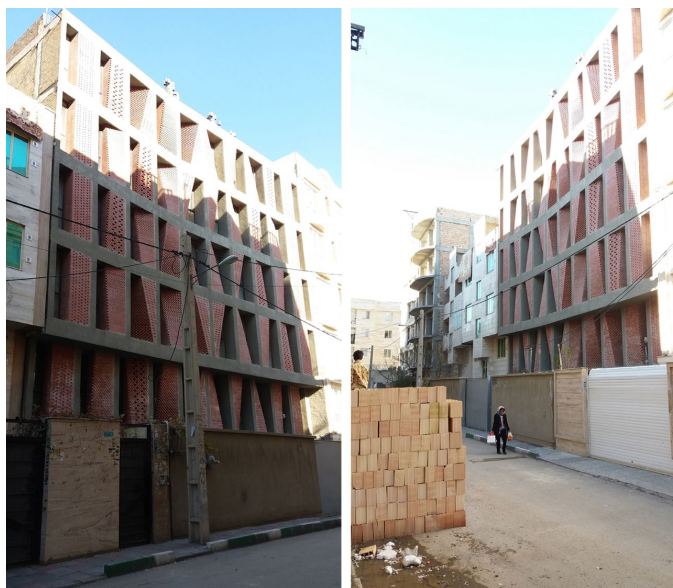
تصویر ۷: آپارتمان کهریزک

طراحی پروژه هنگامی به معمار پیشنهاد شد که «کف دو طبقه آن اجرا شده و کارفرما از لحاظ بودجه با محدودیت‌های بسیاری روبه‌رو بود» (Caat Studio Projects 2015). طراحان با بررسی تیپولوژی آپارتمان‌های مسکونی این منطقه به تعارض و مشکلی اجتماعی- فرهنگی برخوردند. در این‌گونه ساختمان‌ها با طراحی بالکن‌های بزرگ، ساکنان وادار به دیوارکشی این فضا و تبدیل آن به فضای داخلی می‌شوند؛ یا برای حفظ حریم خصوصی، بالکن‌ها را با صفحات شیشه‌ای رنگی یا پلاستیکی می‌پوشانند. این‌ها عواملی هستند که خانه را از نور طبیعی روز محروم می‌کند و همچنین منظره ناهنجاری را به بار می‌آورد؛ در نتیجه طرح مدول‌های آجرکاری به‌عنوان پوشش بالکن‌ها در نظر گرفته شد. برای تأمین نور فضای داخلی واحدها نیز پنجره‌های قدی با عرض کم در کنار این مدول‌ها اجرا شد (تصویر ۸).