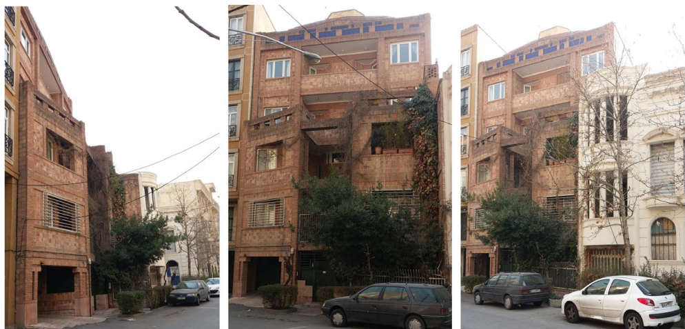
تصویر ۱: آپارتمان مسکونی قیطریه

آپارتمان قیطریه به طراحی مسعود افسرمنش در سال ۱۳۸۲ ش ساخته شده و در محله قیطریه با بافتی ارگانیک در منطقه ۱ در شمال تهران واقع شده است (تصویر ۱). کارفرما طبقات اول و دوم را برای خانواده خود و دو طبقه آخر را برای اجاره دادن در نظر گرفته بود (The Aga Khan Trust for Culture 2011). از این رو معمار برای تأمین نظر کارفرما سازه‌ای بتنی-فلزی برای ساختمان طراحی کرد که در آن این جداسازی دو طبقه ابتدایی از طبقات آخر ساختمان در نظر گرفته شده است. به این ترتیب، طبقات اول حجم ساختمان پیش آمده و حجمی نامنتظم شکل گرفته است که با توجه به مرز سایت سمتی از نمای آن صاف و سمت دیگر پخ و شکسته است. قسمت بالایی نیز به صورت یک نمای ساده آپارتمانی مسطح دیده می‌شود. به بیان دیگر، بافت ارگانیک این محله در سایت نامنتظم ساختمان و به تبع آن در طرح نمای ساختمان نمود می‌یابد. نمای آپارتمان قیطریه با ردیف‌هایی از آجر قرمز رنگ سوراخ‌دار ماشینی در ترکیب با سرامیک قهوه‌ای رنگ پوشش یافته و الگویی شطرنجی و ترکیب بندی موزون و هماهنگ ایجاد می‌کند. همچنین در زوایا و گوشه‌های ستون‌های نما، آجرکاری برجسته با آجرهای ماشینی قرمز رنگ تراش خورده تزئین شده است.