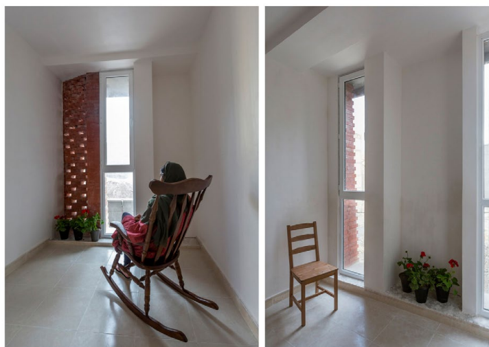
تصویر ۸: فضاهای داخلی آپارتمان کهریزک (Caat studio Projects 2015)