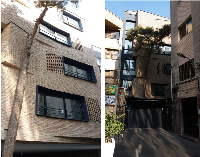
تصویر ۵: آپارتمان ویلا

گوشه‌های آن در عرض به سمت هم حرکت کرده، از درخت کاج قدیمی حیاط که در میانه نما و نزدیک به آن قرار گرفته، حمایت می‌کند و از سایه آن در طول روز بهره می‌گیرد (تصویر ۶). بیرون‌زدگی و چرخش صفحات آجری در زوایای مختلف اختلاف سطحی در نما ایجاد کرده است که باعث سایه‌اندازی در ساعات مختلف روز شده و همچنین دید بهتری به کوچه فراهم می‌آورد. بخشی از پنجره‌های نما با آجرکاری مشبک فخرومدین کار شده است که بازی نور و سایه در فضاهای داخلی را شکل می‌دهد (تصویر ۶).