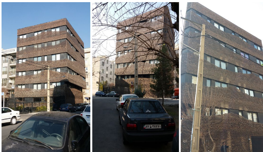
تصویر ۳: آپارتمان چهل‌گره

آپارتمان چهل‌گره به طراحی علیرضا مشهدی میرزا و حبیبه مجدآبادی در سال ۱۳۹۳ش ساخته شده و در محله ستارخان در منطقه ۲ در غرب تهران واقع شده است. این ساختمان پنج‌طبقه در ابتدای کوچه قرار گرفته و از سه نمای کامل برخوردار است. طرح نما بافت مشبک آجرکاری از جنس آجر نسوز صنعتی قهوه‌ای‌رنگ است که در تراز طبقات به صورت منحنی‌های موج‌مانندی که به‌طور متناوب بالا و پایین می‌روند، به نظر می‌رسد (تصویر ۳).