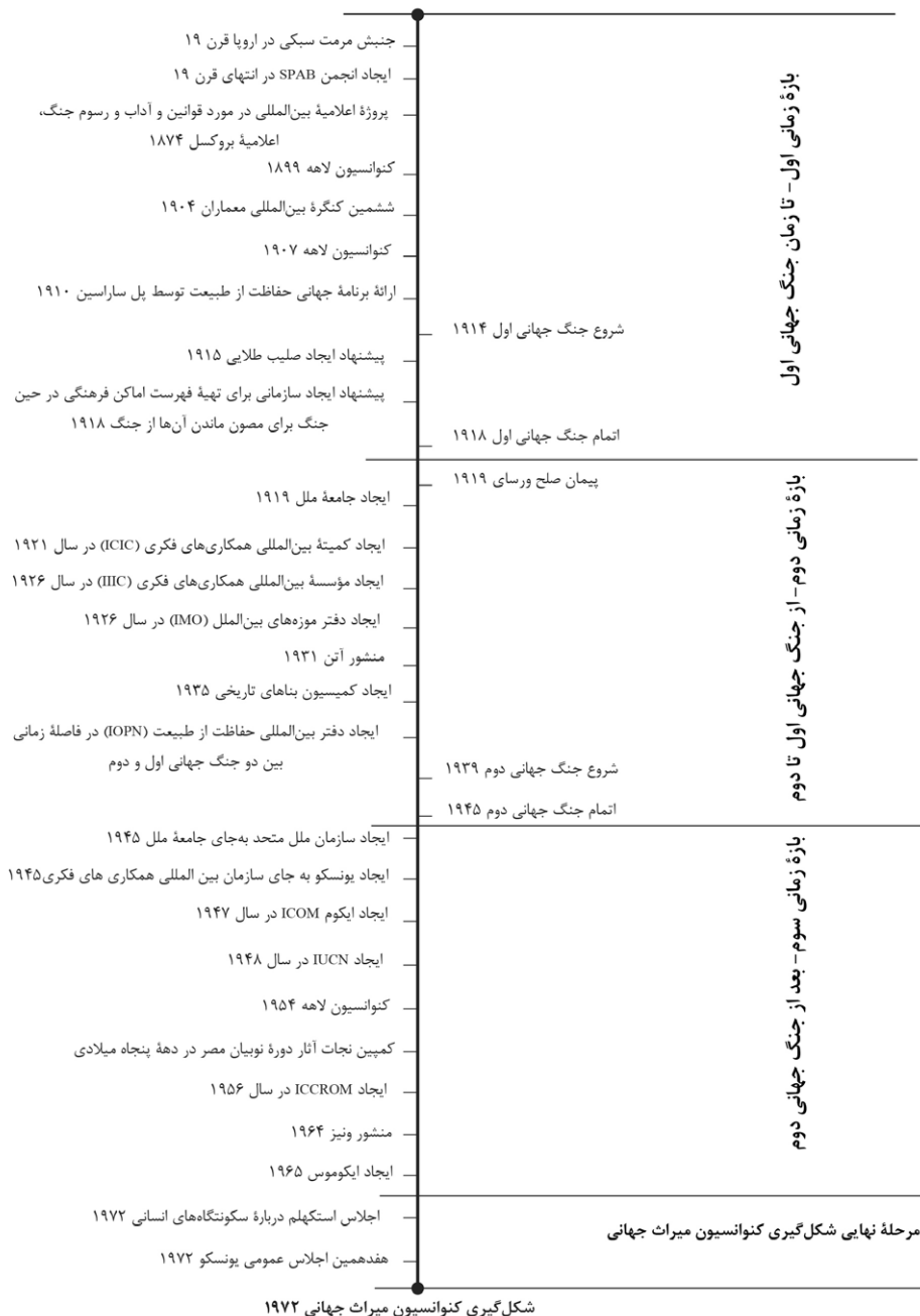
تصویر ۲: جدول زمانی وقایع منتهی به شکل‌گیری کنوانسیون میراث جهانی

میراث طبیعی هم‌پای میراث فرهنگی در هنگام شکل‌گیری کنوانسیون میراث جهانی مورد توجه قرار گیرد و کنوانسیون نقطه تلاقی این دو باشد. با توجه به مطالب بیان شده می‌توان گفت که شکل‌گیری کنوانسیون متأثر از زمان شکل‌گیری آن بود اما تلاش‌های صورت‌گرفته پیش از آن به توسعه توجه به میراث مشترک بشریت مؤثر واقع شده بود.