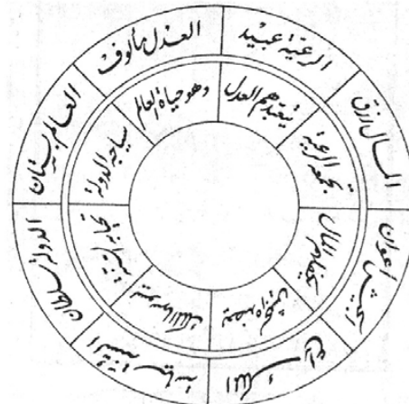
تصویر ۱: چرخه عدالت بر مبنای بیان ارسطو.

در این چرخه مفاهیم متعددی در پیوند با یکدیگر ذکر شده است؛ از جمله اینکه عالم به‌مثابه بستانی است که حیاتش از عدالت است. همچنین خاندان حافظ سُنّت و سُنّت شیوه حکومتی است که مُلک به کار می‌بندد (London 2011, 426).