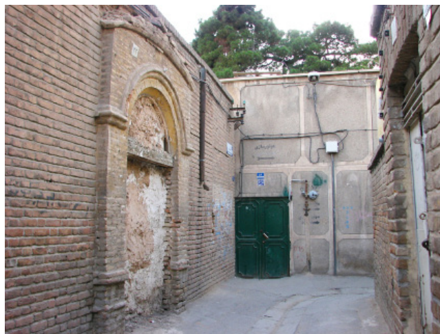
تصویر ۳: تخریب تزیینات بنا توسط مالک به‌منظور جلوگیری از ثبت (Rezaei 2014)