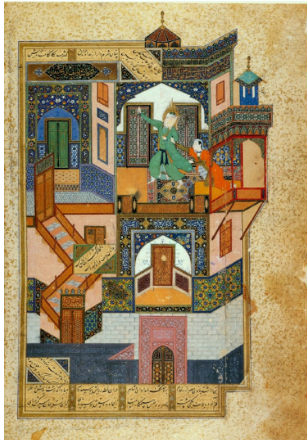
تصویر ۲: یوسف و زلیخا، کمال‌الدین بهزاد، بوستان سعدی، اواخر سده نهم هجری، کتابخانه سلطنتی قاهره