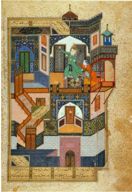
تصویر ۲: یوسف و زلیخا، کمال‌الدین بهزاد، بوستان سعدی، اواخر سده نهم هجری، کتابخانه سلطنتی قاهره