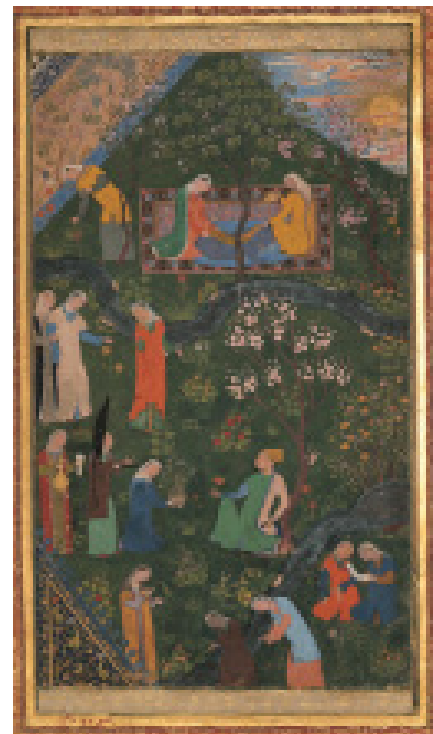
تصویر ۳: سلطان حسین میرزا در تفرج‌گاه (نیمه راست)، کمال‌الدین بهزاد، مرقع گلشن، صفحه ۶۲، اواخر سده نهم هـ، کاخ گلستان