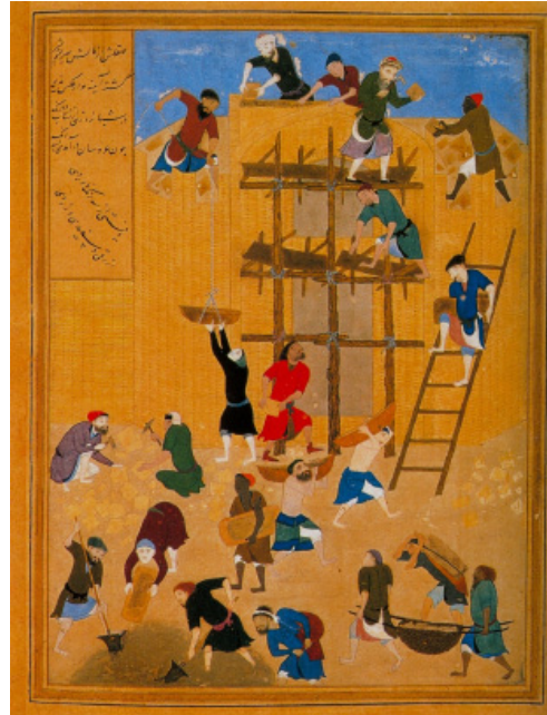
تصویر ۱: ساختن کاخ خورنق، کمال‌الدین بهزاد، خمسه نظامی، اواخر سده نهم هجری، موزه بریتانیا

از این دست نگاره‌ها بخشی اختصاصاً به عمل و ساخت معماری مربوط است؛ مثل نگاره‌هایی که در مرقد اصناف آمده است و اطلاعاتی در زمینه فهم معماری به مثابه پیشه به‌دست می‌دهد. این دسته از نگاره‌ها برای مطالعه موضوعاتی از قبیل چگونگی طرح‌اندازی یا تبدیل طرح به بنا، ابزار و مواد کار معماران یا استادکاران، گروه سازندگان و شناخت اجتماعی ایشان و موضوعاتی از این قبیل مناسب‌اند. این نگاره‌ها گرچه معدودند و کمتر مورد توجه قرار گرفته‌اند، مدرک بی‌نظیری برای چنین موضوعاتی است.